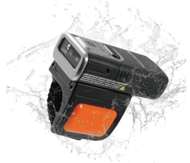
IP65 방수/방진 등급