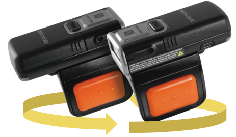
양 손 모두 사용 가능한 링 트리거

관련 문의사항이 있을 시 service@pointmobile.com 을 통해 전달해 주시기 바랍니다.