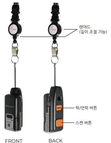
USB-C 슬라이드 (랜야드 연결 가능)

Corporate Headquarters Point Mobile Co., Ltd. pm_sales2@pointmobile.com +82 2 3397 7870